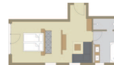
Panoramasuite „Edelweiß II“

Die Preise verstehen sich pro Zimmer inklusive Sepperts Wohlfühlfrühstück vom Buffet sowie MwSt.