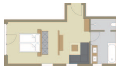
Panoramasuite „Edelweiß I“

Die Preise verstehen sich pro Zimmer inklusive Sepperts Wohlfühlfrühstück vom Buffet sowie MwSt.